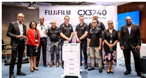
L'équipe de EO Solutions avec les représentants de Fujifilm, SA avec la nouvelle imprimante de photobook.

En opérant un virage vers l'instantané, Fujifilm a su inscrire ses produits dans l'air du temps pour répondre et anticiper les attentes de ses clients à travers le monde. Grâce à la technologie Bluetooth , les téléphones mobiles se transforment en télécommande avec pour interface une application développée à cet effet. Elle permet non seulement de contrôler les appareils photo instantanés mais aussi d'ajouter des effets et d'avoir le choix de sauvegarder ou d'imprimer.